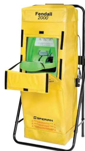
Fendall 2000 ci-haut avec l'accessoire chauffant et le support universel ( vendus séparément )