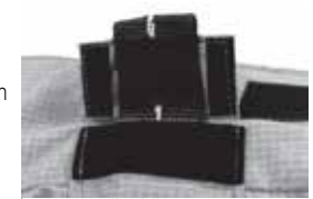
Rabat du tube

Étape 5 – Passez le coulisseau saillant à travers l'ouverture du tube pour qu'il fasse bon contact avec la bande couverte de boucles cousue à l'arrière du manteau. Pliez ensuite le rabat du tube et appuyez fermement pour le tenir en place.